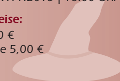
„Der kleine Muck“ 2014