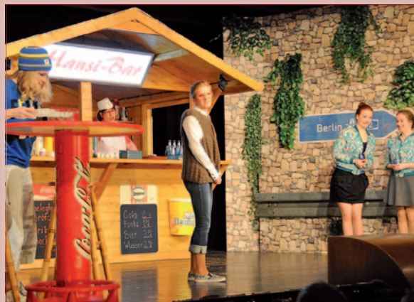
„Currywurst mit Pommes“ 2015

P Bitte benutzen Sie auch die Parkplätze am Sterkrader Tor.