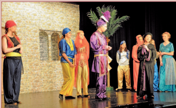
„Der kleine Muck“ 2014

Wir richten uns nach den Bedürfnissen der Menschen und tun dies aus Überzeugung. Stadtparkasse Oberhausen - Gut für Oberhausen. Besuchen Sie uns auch unter www.stadtparkasse-oberhausen.de