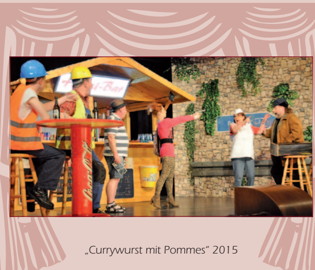
„Currywurst mit Pommes“ 2015

Der Schauspieler-Autor Hoffmann greift genüsslich in die Trickkiste des Boulevardtheaters, um zuletzt da zu landen, wo jedes Stück endet: beim Schlussapplaus.